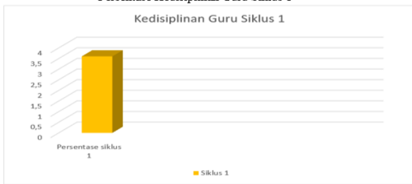
Persentase Kedisiplinan Guru Siklus 1

Pada siklus 1 ini, ada 5 orang guru yang diberikan pembinaan berkelanjutan. Setelah diberikan pembinaan, ternyata ada dua orang guru yang mengalami perubahan yaitu lebih disiplin dalam masuk kelas untuk mengajar yaitu guru D dan guru N. Oleh sebab itu, dalam siklus ini persentase peningkatan kedisiplinan guru yaitu